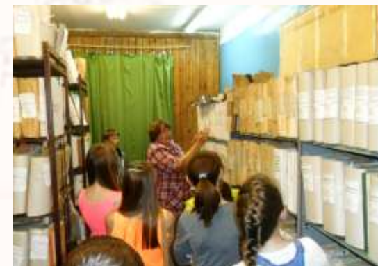
Экскурсия 2013 г.