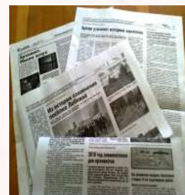
Публикации в газете