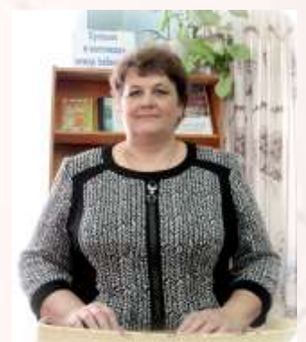
Презентация на краеведческих чтениях