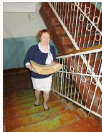
Приём запросов, поиск информации и путь в рабочую комнату