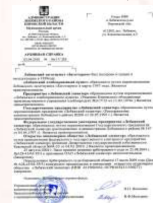
Ответ на запрос